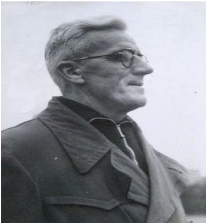
Karl Schelenz, criador do handebol