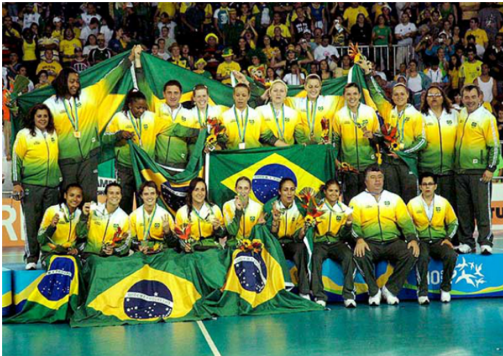
Seleção brasileira feminina de handebol

Em 2013, ocorreu na Sérvia o campeonato feminino mundial de Handebol. Novamente, a seleção brasileira foi campeã.