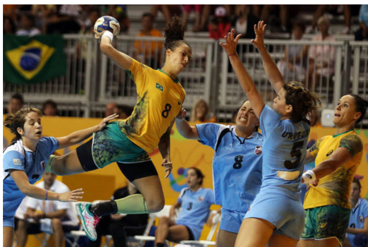
Partida de Handebol

Sendo assim, para homens ela tem 58,4 cm de circunferência e massa de 453,6 gramas. Já para mulheres, ela tem 56,4 cm de circunferência e massa de 368,5 gramas.